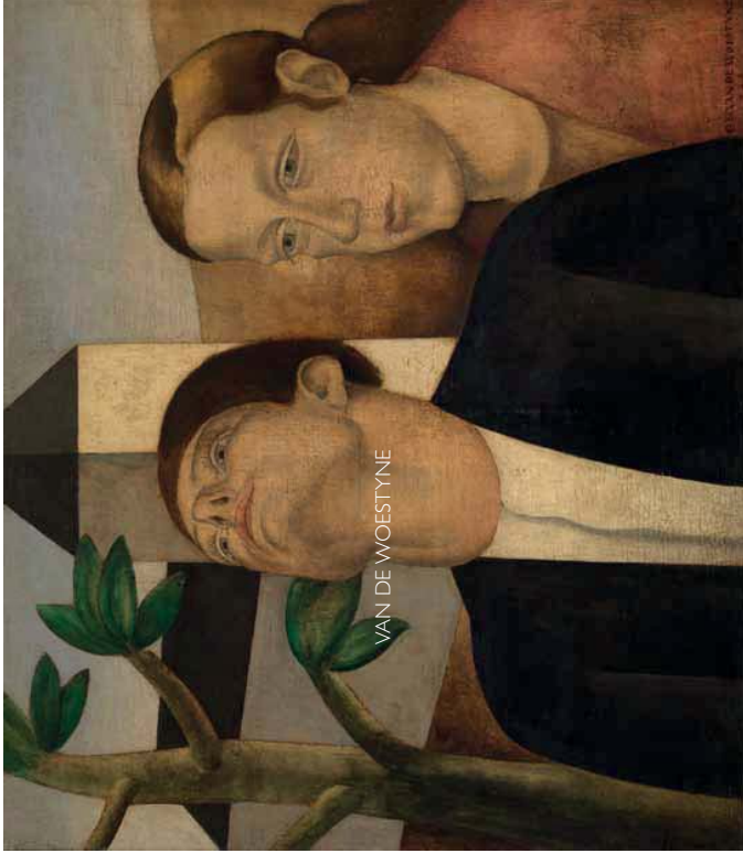
© Lukasaert en Rondero - Foto: Hugo Meertens