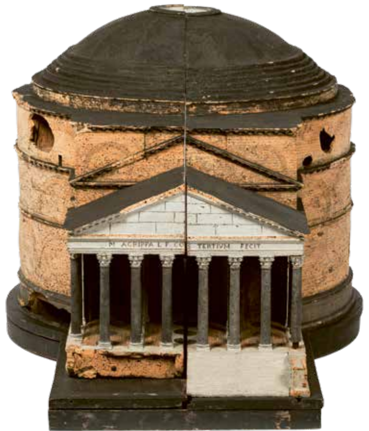
Buitenzijde van het kurkmodel van het Pantheon tijdens de restauratie