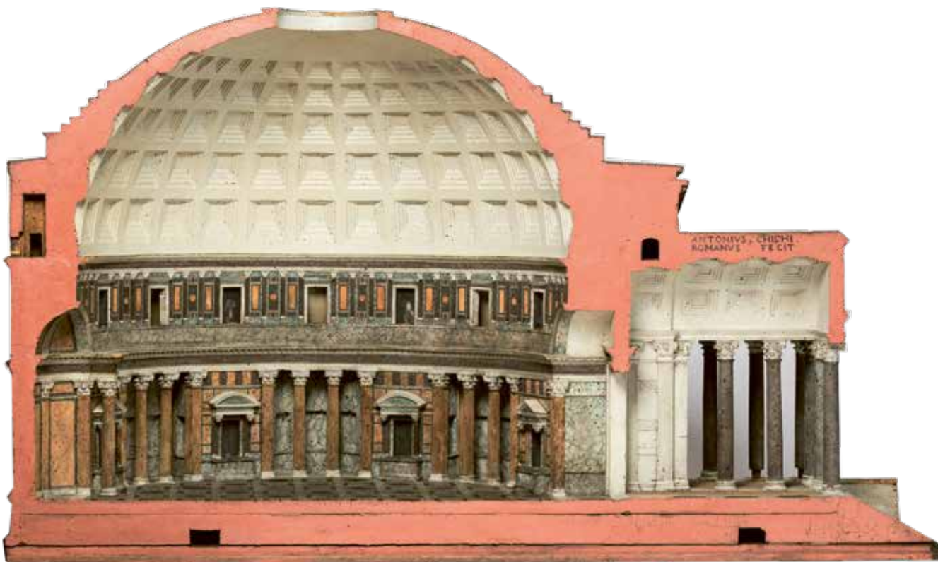
Eén van de binnenzijden van het kurkmodel van het Pantheon na restauratie Foto: Koninklijk Instituut voor het Kunstpatrimonium, Brussel

Antonio Chichi wist de schitterende marmerdecoraties schijnbaar moeiteloos te imiteren Foto: Koninklijk Instituut voor het Kunstpatrimonium, Brussel