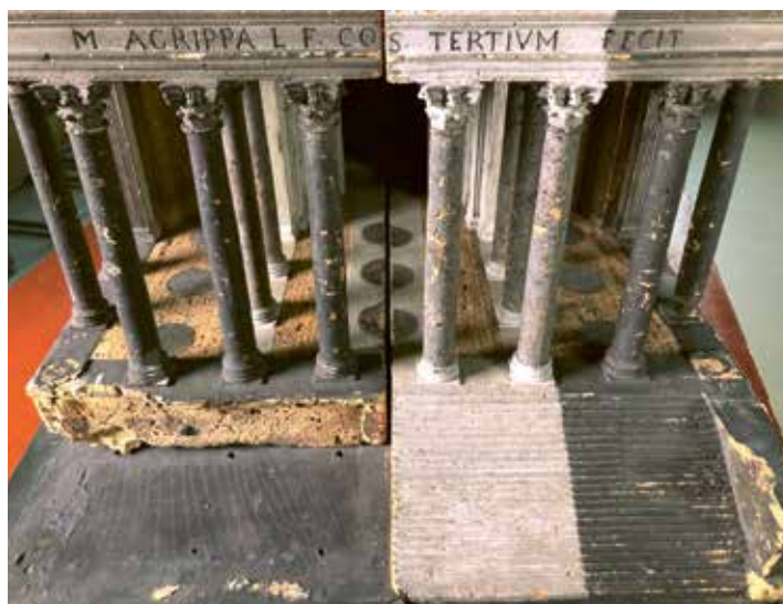
De kleurrijkdom van het kurkmodel kwam terug aan het licht

INFO Het kurkmodel van het Pantheon is te zien in het GUM, Gents Universiteitsmuseum – www.gum.be – ARCHIEF GUM – Forum voor Wetenschap, Twijfel en Kunst: okv 2020, nummer 5 – Het oude Rome herleeft: okv 2019, nummer 4, blz. 13-16 – www.okv.be/tijdschrift