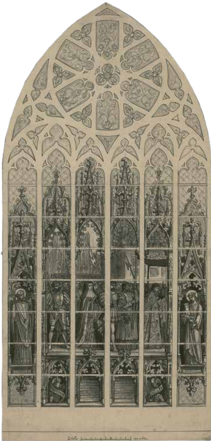
Brussel, Sint-Michiel- en Goedelekathedraal, ontwerp-tekening op schaal van het glasraam Dertiende episode uit de geschiedenis van het Heilig Sacrament van Mirakelen : de instelling van de processie van het Allerheiligst Sacrament van Mirakelen, 1865

gemaakt voor grootse restauratiecampagnes van vooral die monumenten die de christelijke middeleeuwen belichaamden, het ideaal waaraan de nieuwe culturele identiteit zou worden gespiegeld.