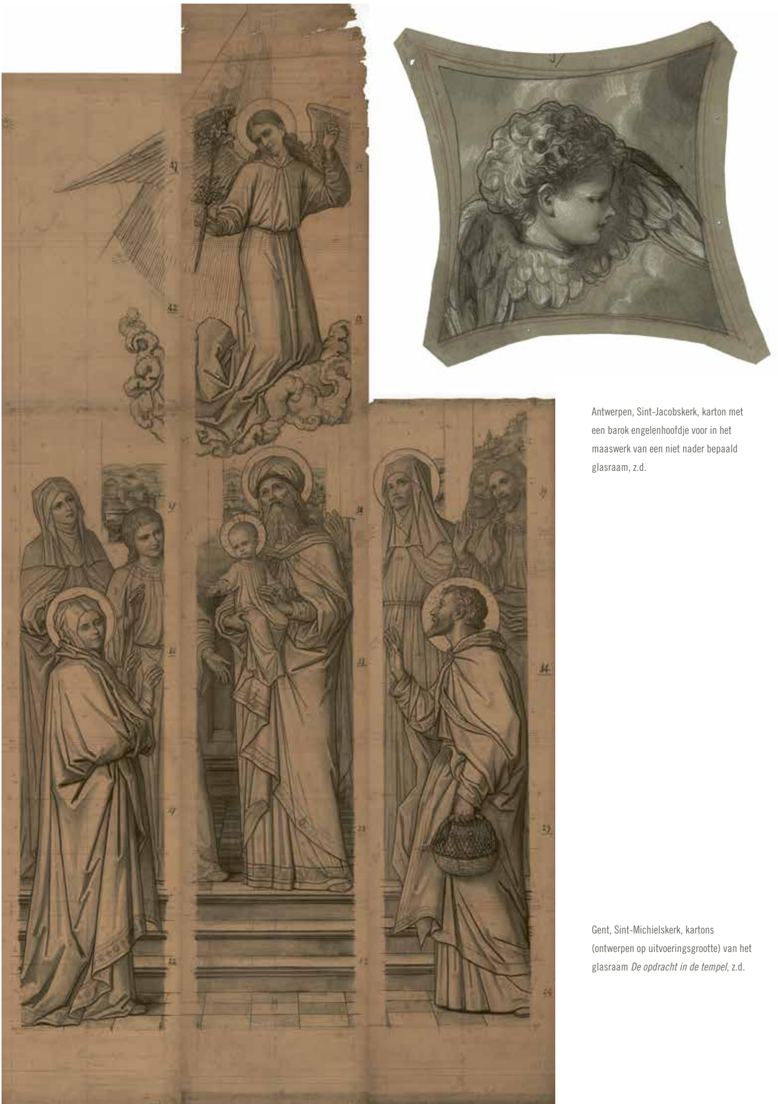
Antwerpen, Sint-Jacobskerk, karton met een barok engelenhoofdje voor in het maaswerk van een niet nader bepaald glasraam, z.d.