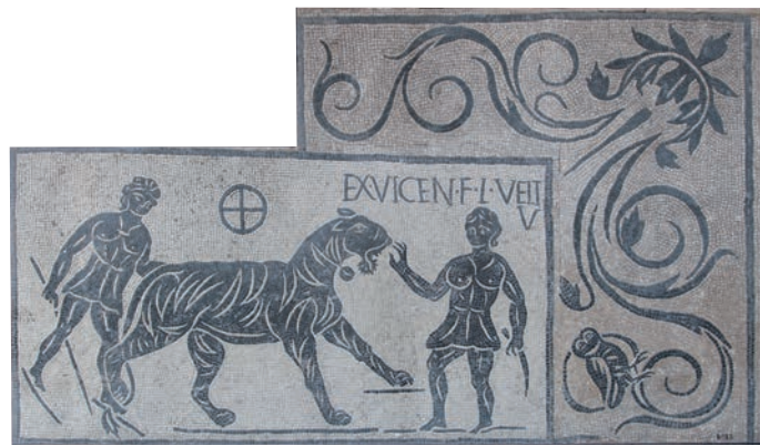
Mozaïek met afbeelding van een jachtscène, Rome, tweede eeuw n. Chr., 169 x 228 x 16 cm COLOSSEUM, ROME

plaats aan 50.000 toeschouwers. De openingsfeesten duurden van juni tot september. Er viel heel wat te beleven: heuse zeeslagen (waarvoor de arena in een meer veranderde), martelingen, acrobatennummers, dierenshows, jachtpartijen en uiteraard gladiatorenvechten.