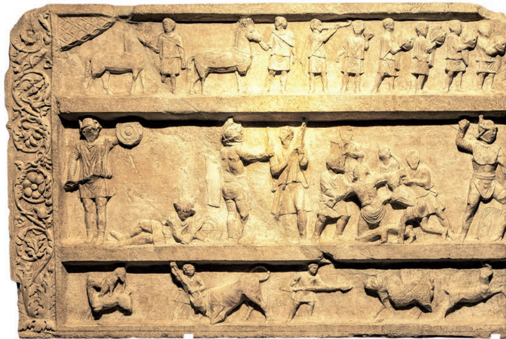
Reliëf met afbeelding van een openingsstoet, gladiatoren- en dierengevechten, 20-50 n. Chr., marmer NATIONAAL ARCHEOLOGISCH MUSEUM, NAPELS

In het Gallo-Romeins Museum in Tongeren loopt de tentoonstelling Gladiatoren - Helden van het Colosseum . Zullen er straks opnieuw spektakels plaatsvinden in de oudste arena van Rome?