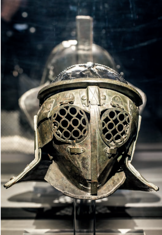
Helm van een provocator, Pompeï, tweede helft 1ste eeuw n. Chr., brons NATIONAAL ARCHEOLOGISCH MUSEUM, NAPELS