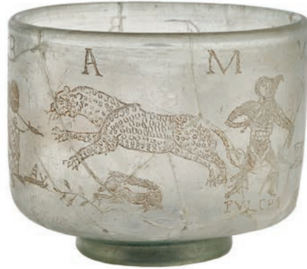
Glazen drinkbeker met amfiteaterscènes, Trier, eerste helft 4de eeuw n. Chr., hoogte 8,9 cm RHEINISCHES LANDESMUSEUM, TRIER