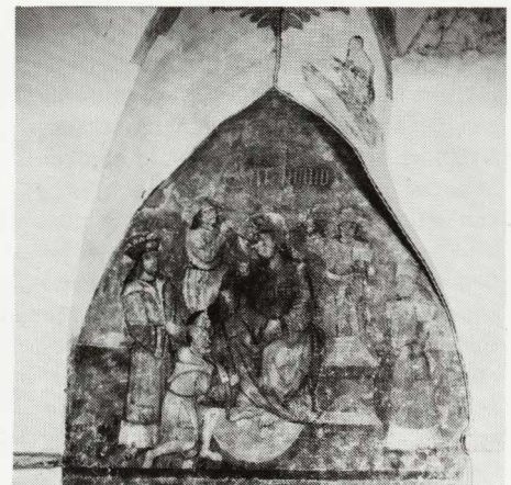
pagina 26: Daniël in de leeuwenkuil, Crypte St.-Baafskathedraal, Gent