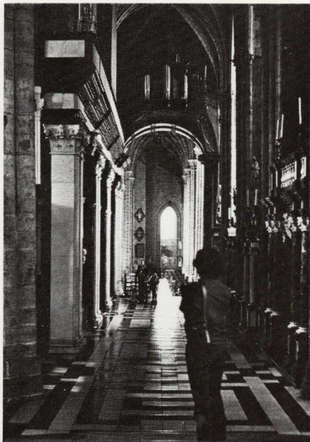
Binnenaanzichten van de St.-Baafskathedraal te Gent

Op de plaats van de huidige kathedraal stond vroeger de St.-Janskerk, oorspronkelijk een kapel afhankelijk van de abdij van St.-Pieters en misschien gewijd in 942. Daarvan bleef niets bewaard. De crypte of ondergrondse kapel klimt slechts op tot de twaalfde eeuw. Omstreeks 1274 werd begonnen met de bouw van het vroeg-gotisch koor, dat zeer groots was opgevat. De kranskapellen met het daarbij horend gedeelte van de kooromgang kwamen in het begin van de vijftiende eeuw tot stand.